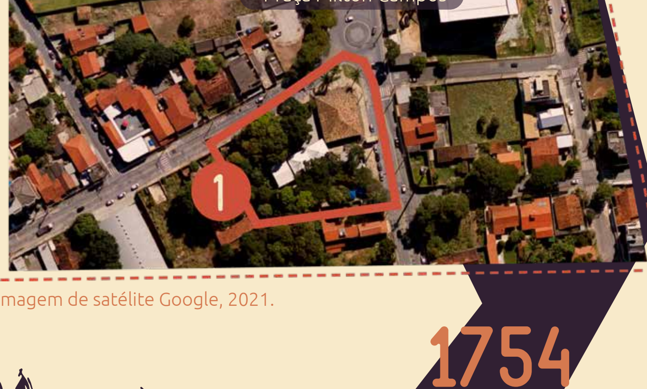
Imagem de satélite Google, 2021.