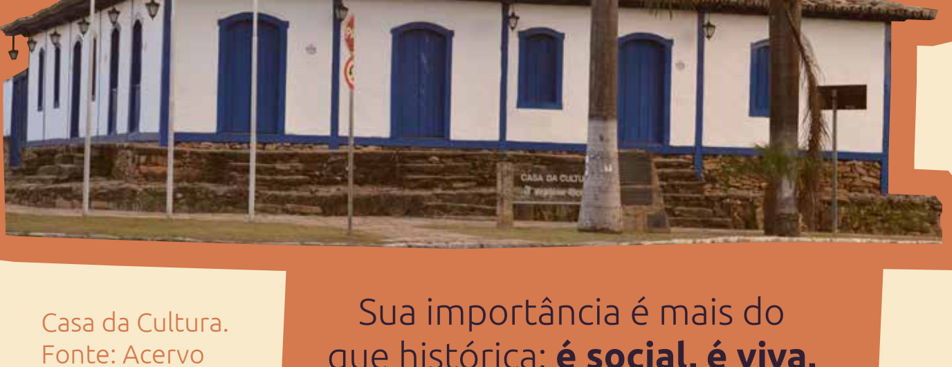
Casa da Cultura.

A Casa da Cultura hoje é lar de um significativo acervo de peças que contam a história do município e mais do que isso, é morada de inúmeras histórias de tantos sujeitos que por ela passam e passaram.