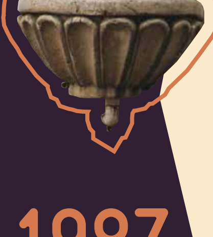
Detalhe do Chafariz.

Foi somente no ano de 1984 que a Prefeitura desapropriou o prédio. Dois anos mais tarde, começaram as obras de restauração do edifício , preservando parcialmente as características originais do método construtivo, com sistema de vedação pau-a-pique .