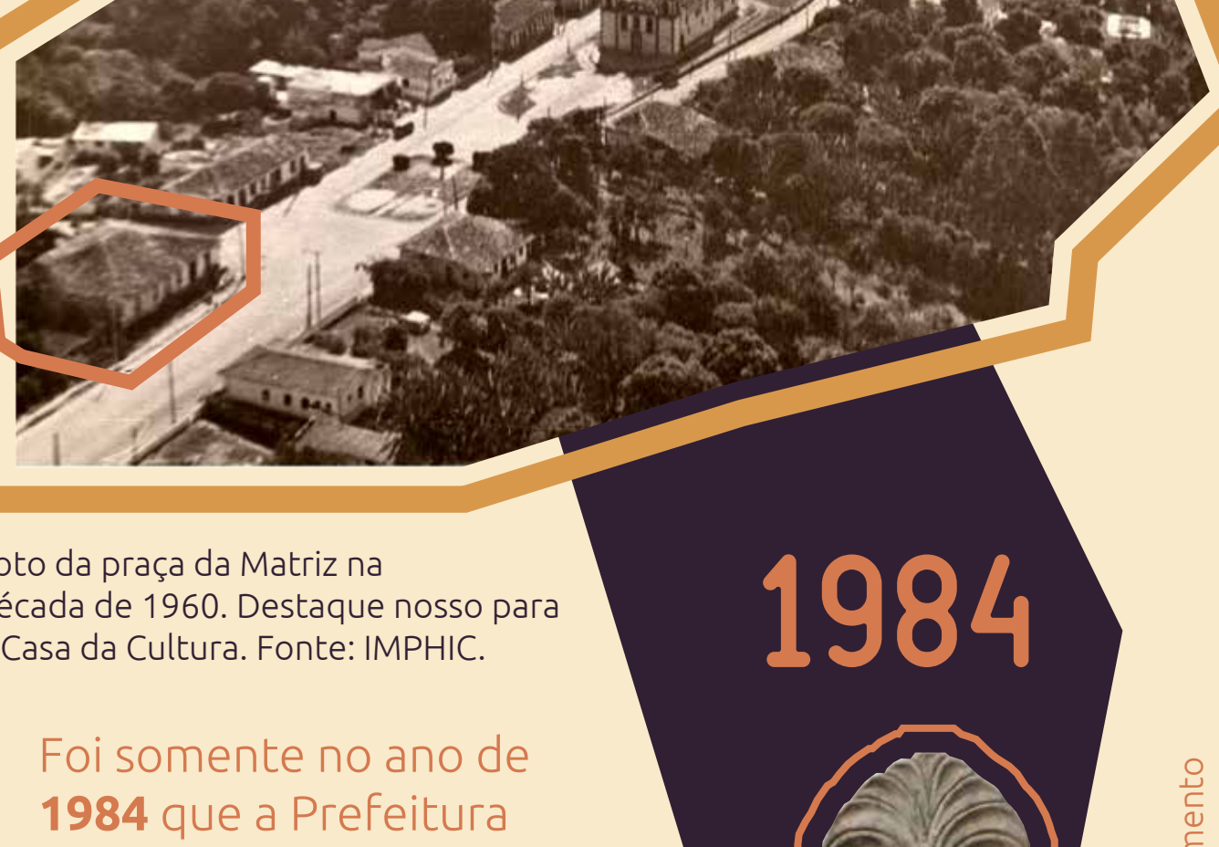
Foto da praça da Matriz na década de 1960. Destaque nosso para a Casa da Cultura.

Ao longo dos anos já abrigou famílias , já foi comércio, mercearia e até boteco , com direito a sinuca e tudo mais.