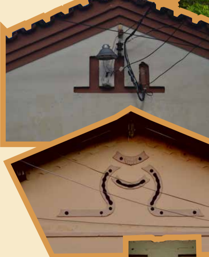
Praça João Jacinto de Paula Google Imagem, 2021.