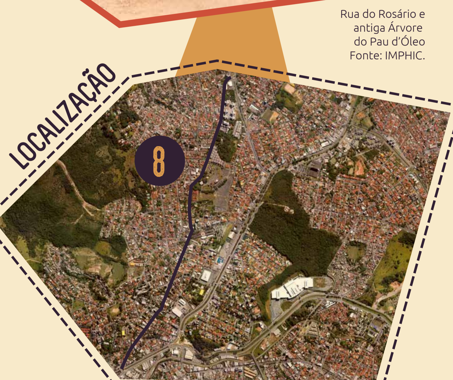
Rua do Rosário e antiga Árvore do Pau d'Óleo